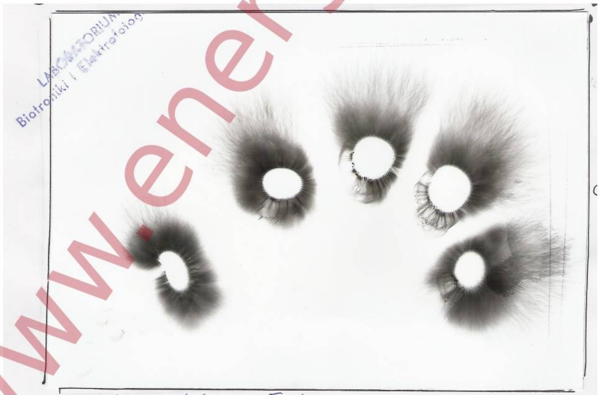
Aura palców na płycie po 10 sekundach