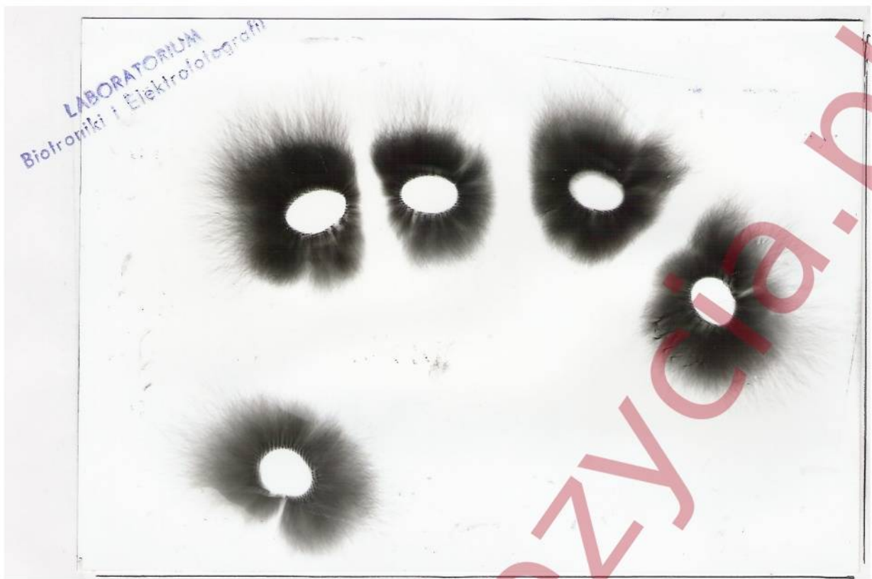
Aura palców bez płyty